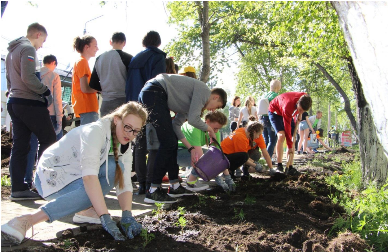
Акция «Мой волшебный мир»