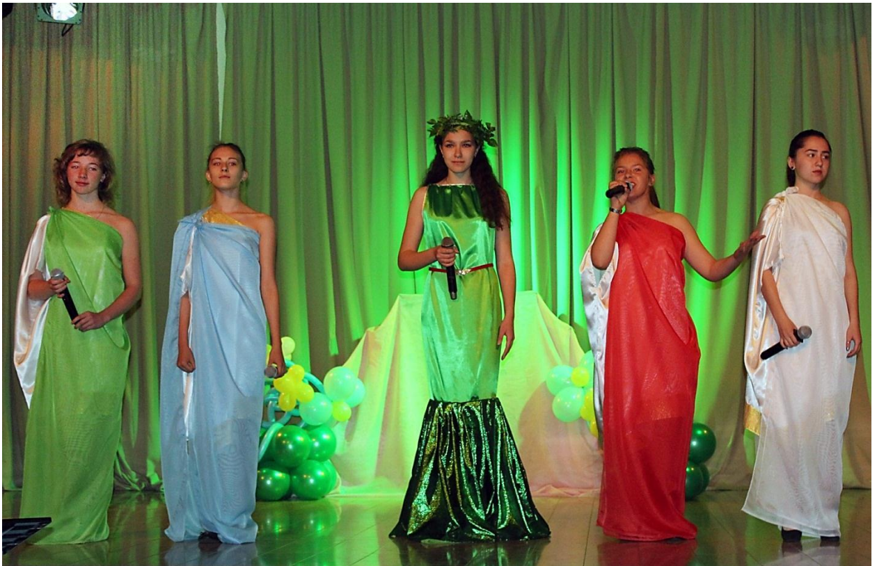
Открытие БЭУШ «BEST» - 2016