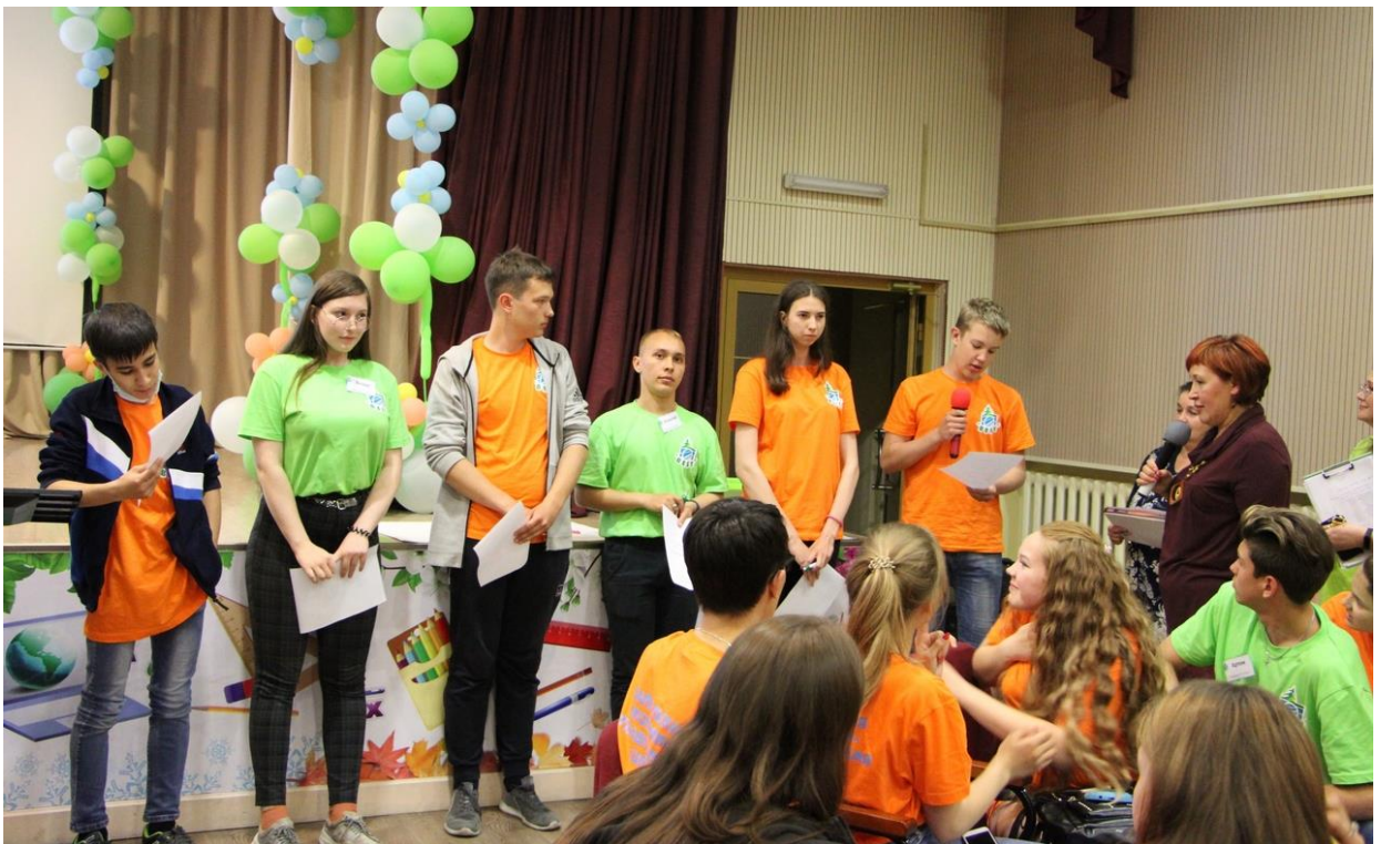
Профориентационная игра «Выборы генерального директора фирмы»