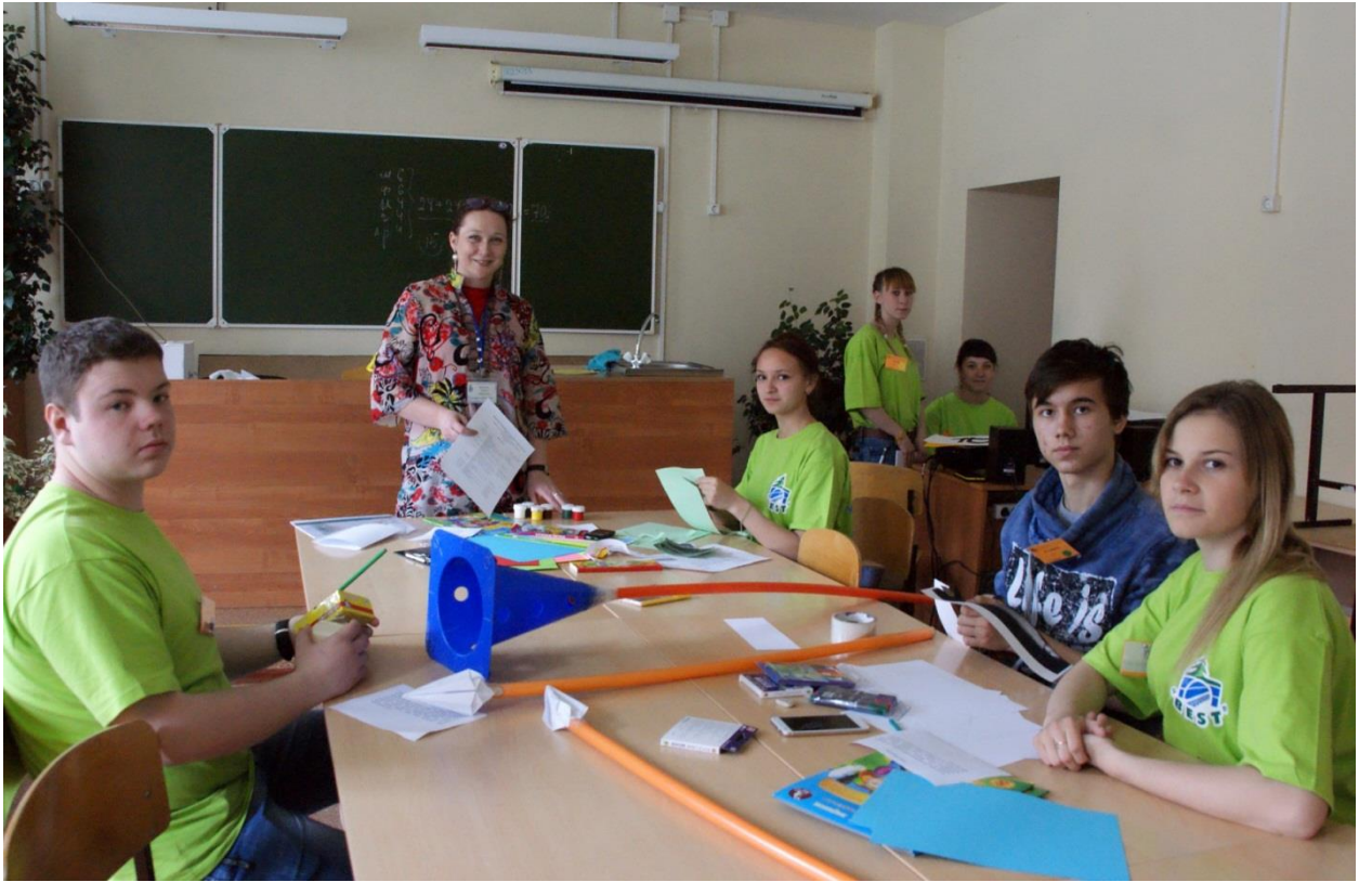
Кипит работа у модераторов