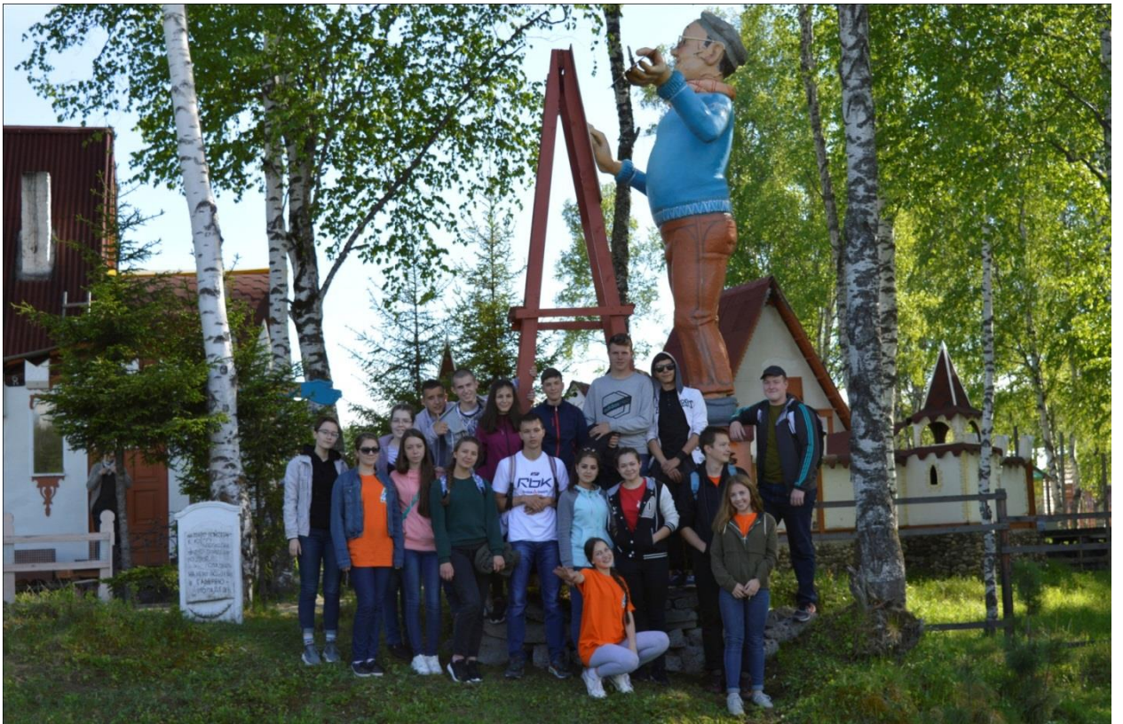
Экскурсия в Дом художника