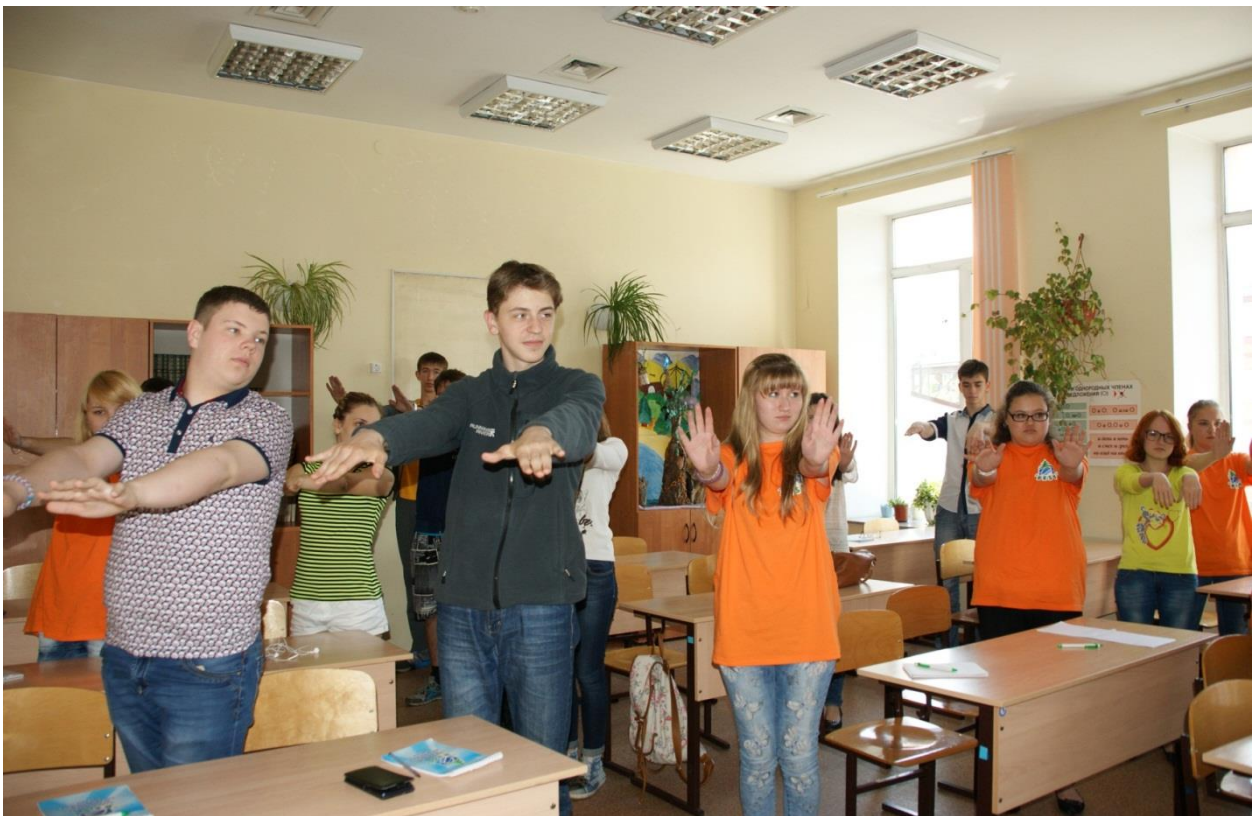
Подготовка к лекциям