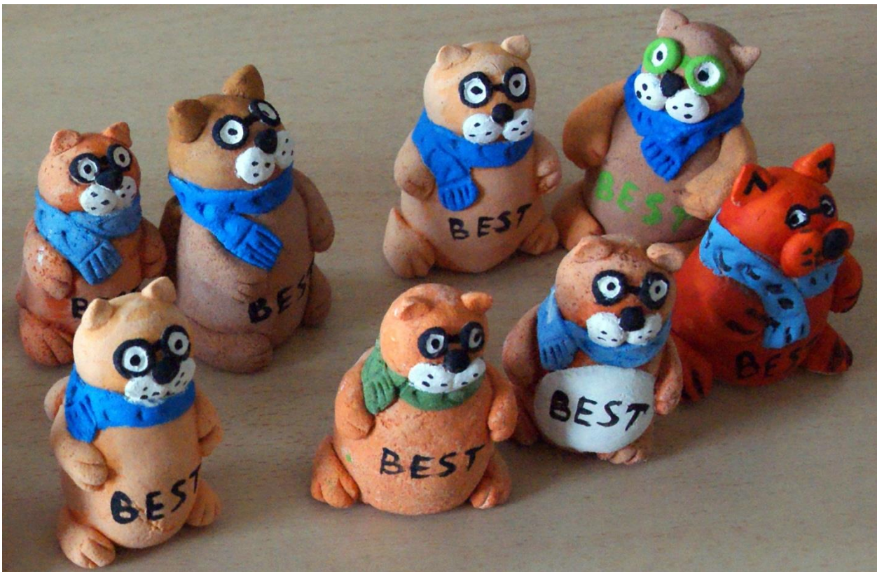
Результаты мастер-класса «Я-художник»