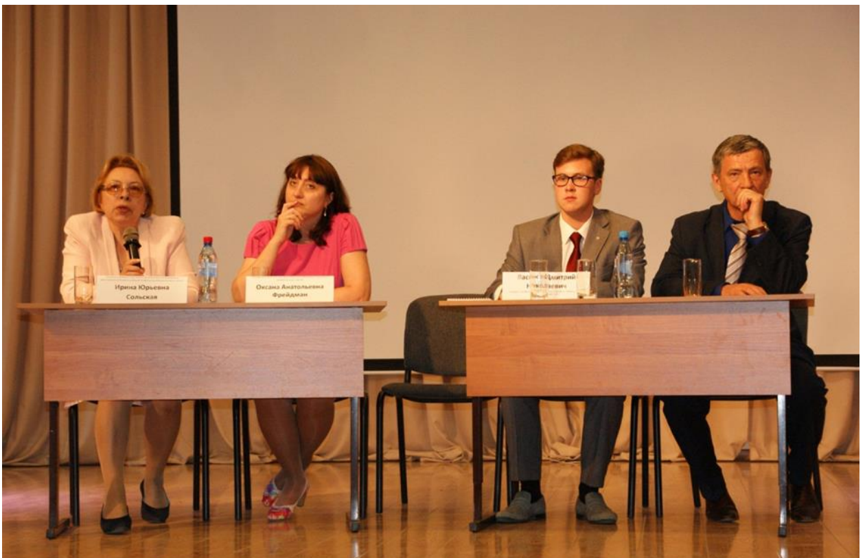
Пресс-конференция «Потребности рынка труда на современном этапе развития экономики России»