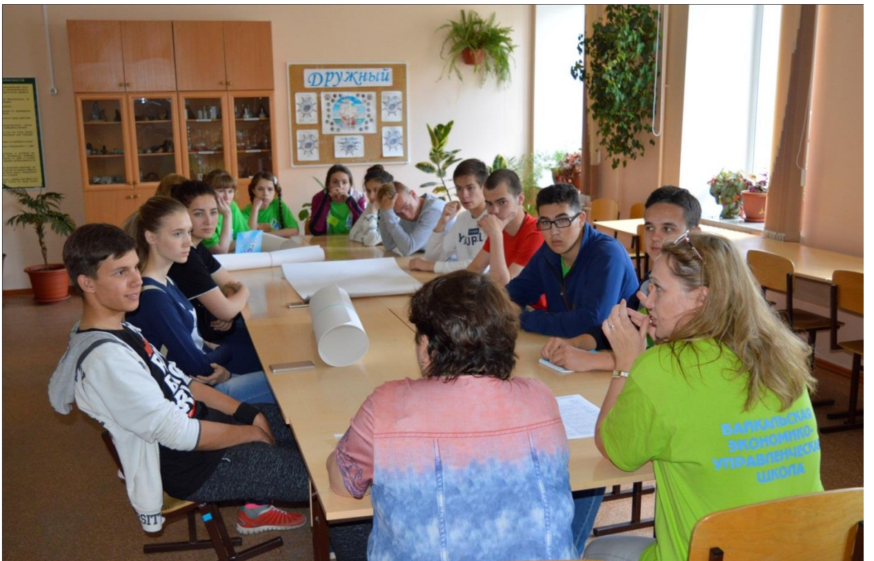
Планерки с модераторами