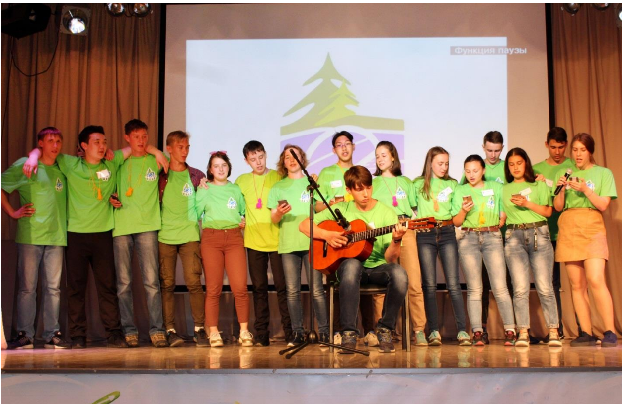
Выступление модераторского отряда