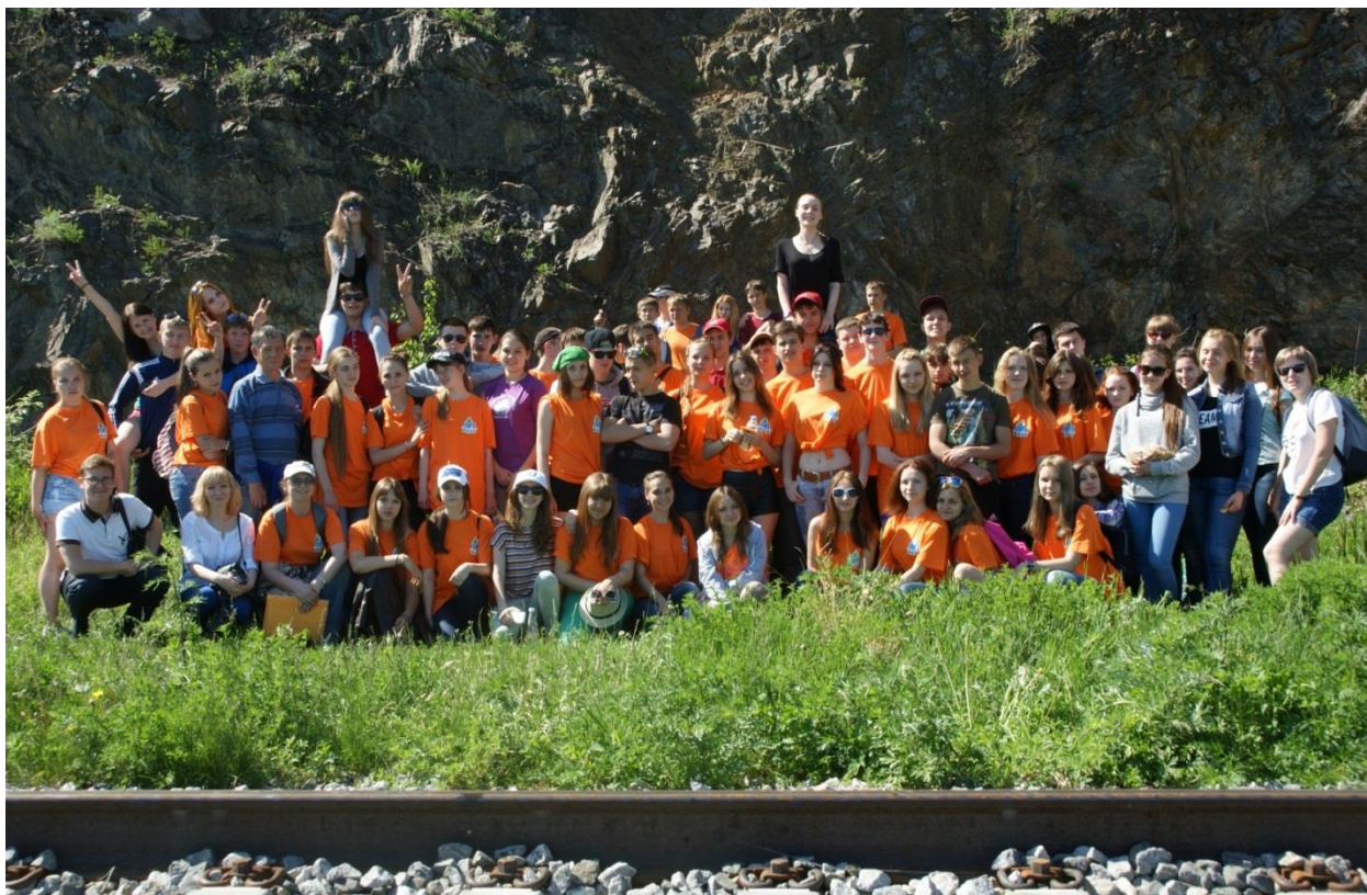
Поход на Кругобайкальскую железную дорогу