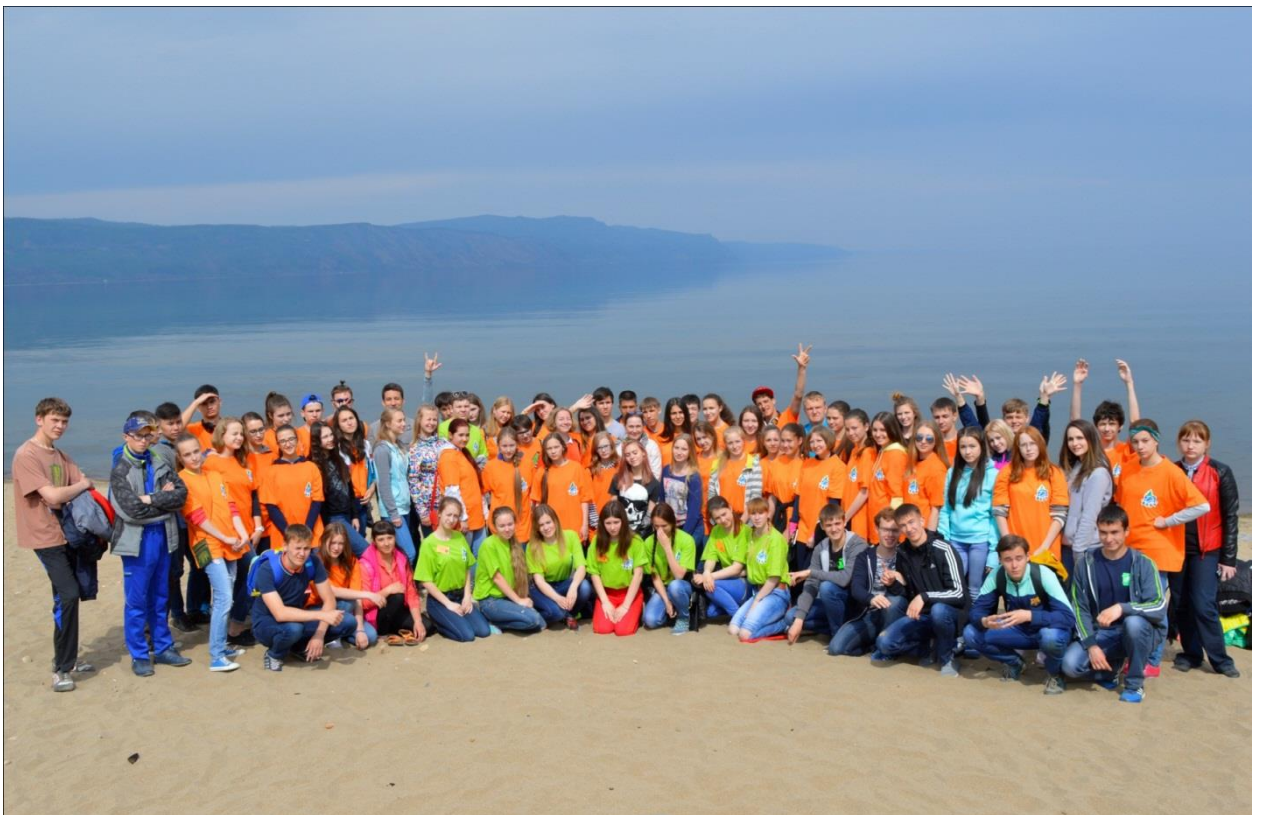
Прогулка на Байкал, пляж у м.Шаманского.