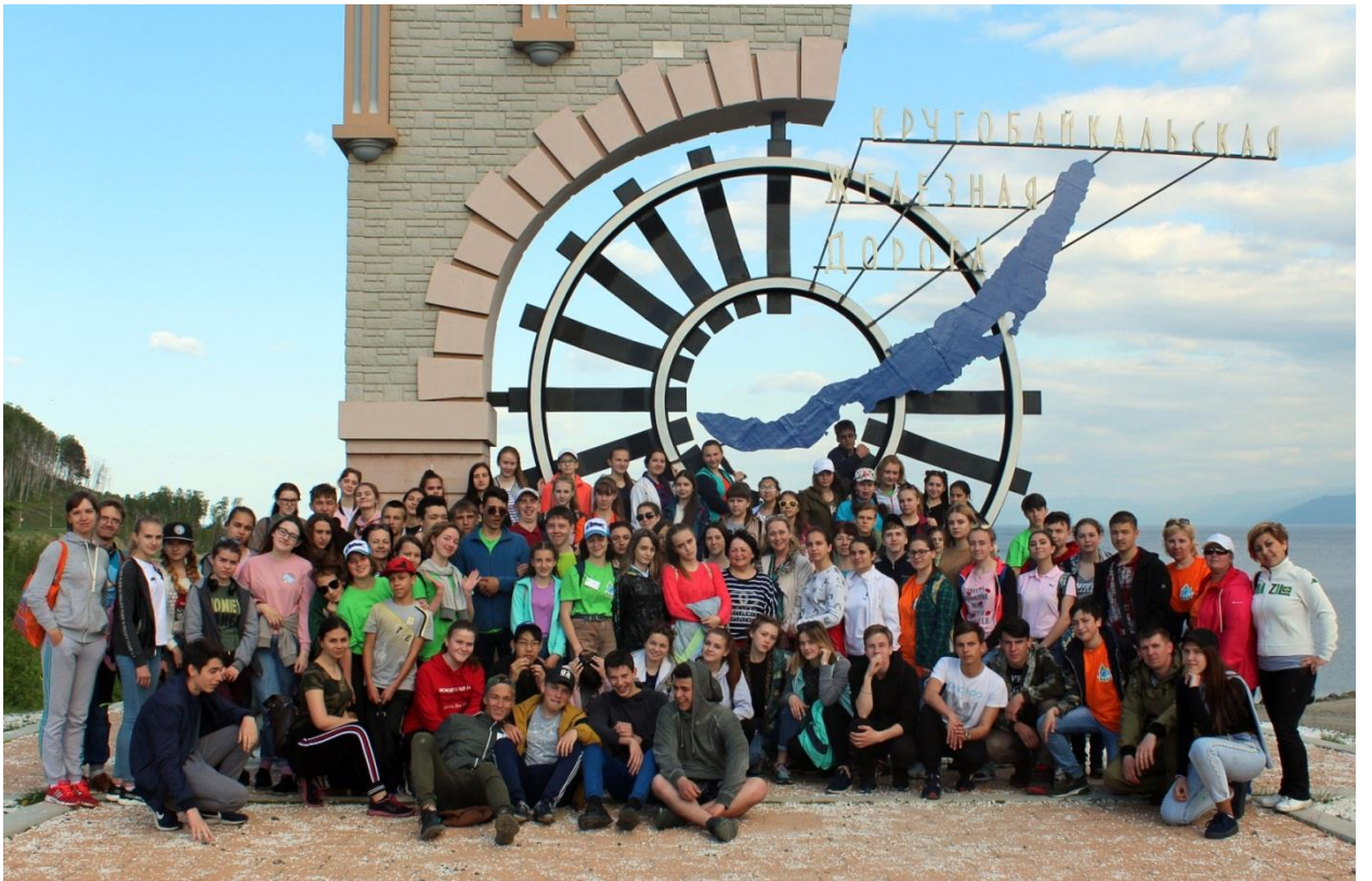
Поход на КБЖД, п.Култук.