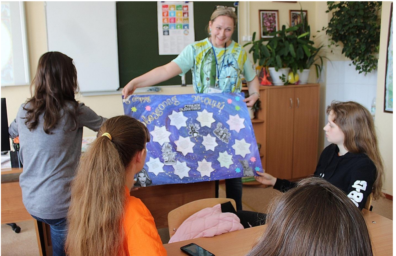
Выпуск отрядных газет