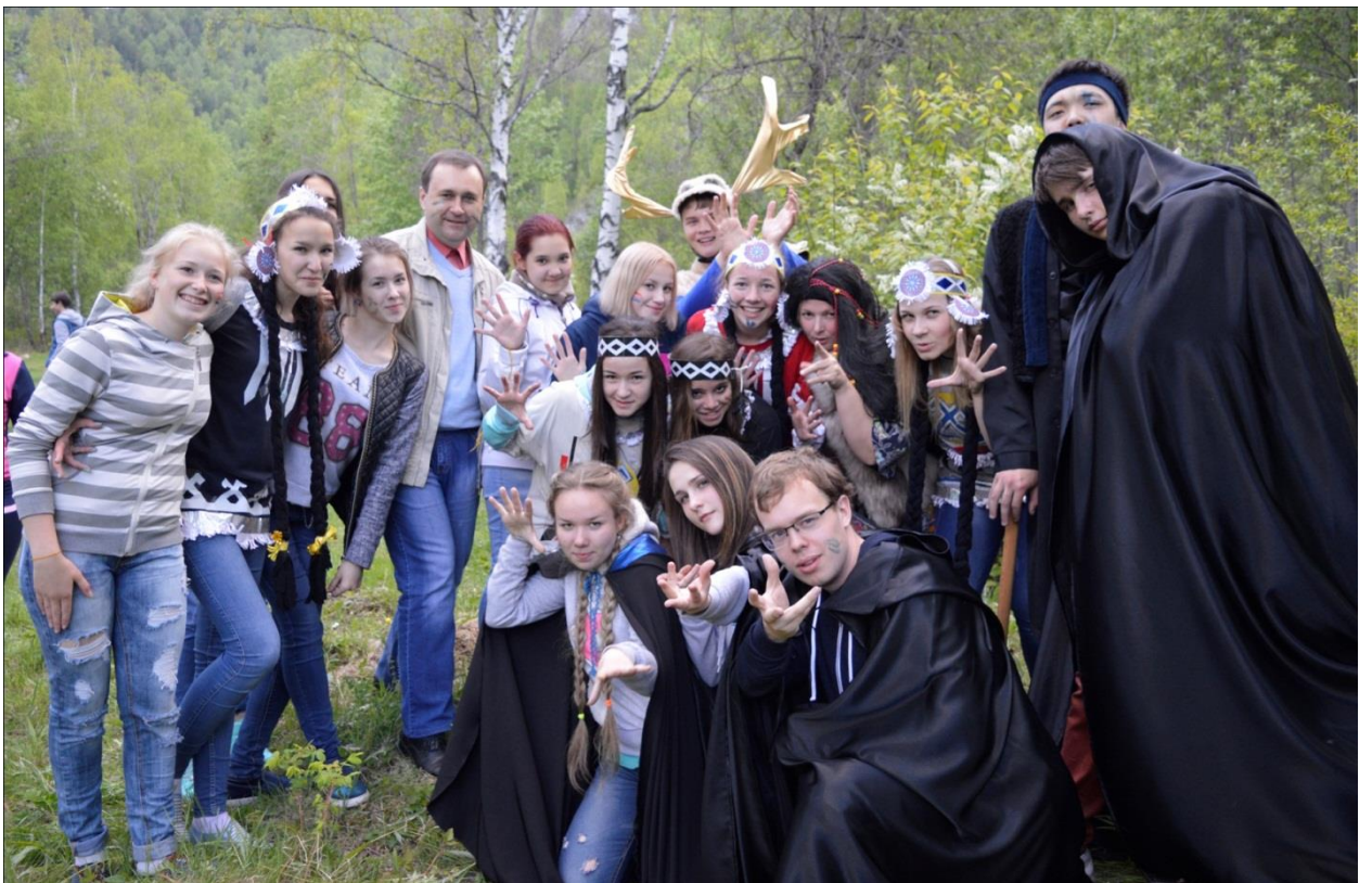
Спортивно-развлекательное мероприятие «В гостях у горных духов»