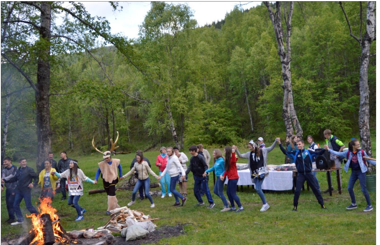
Спортивно-развлекательное мероприятие «В гостях у горных духов»