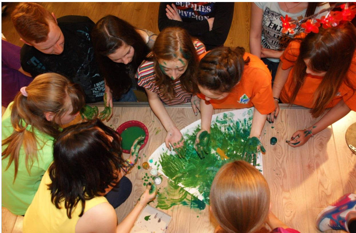
Большая эколого-психологическая игра «Четыре стихии»