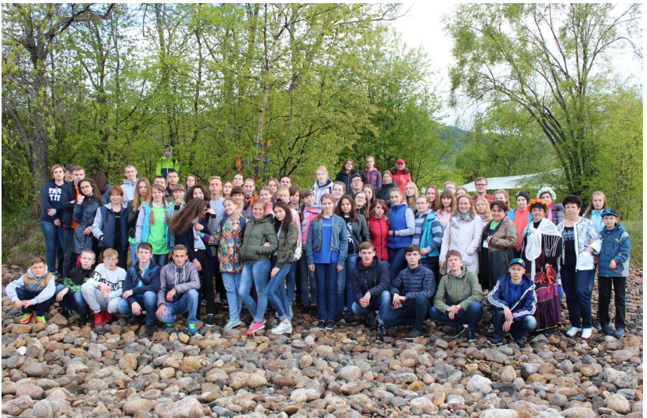
Спортивно-развлекательное мероприятие «В гостях у Байкала»