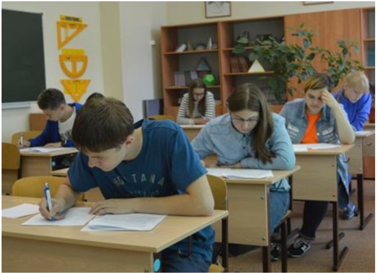
Олимпиада общественных наук «BEST»