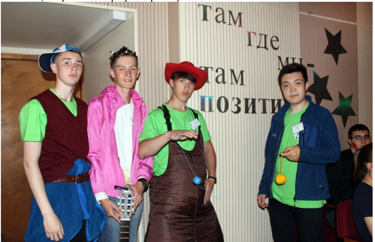
Психолого-экономическая игра «Неоготические истории»