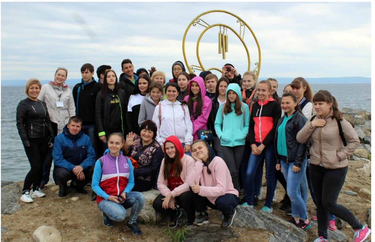
Экскурсия в г.Байкальск, скульптура «Ухо Байкала»